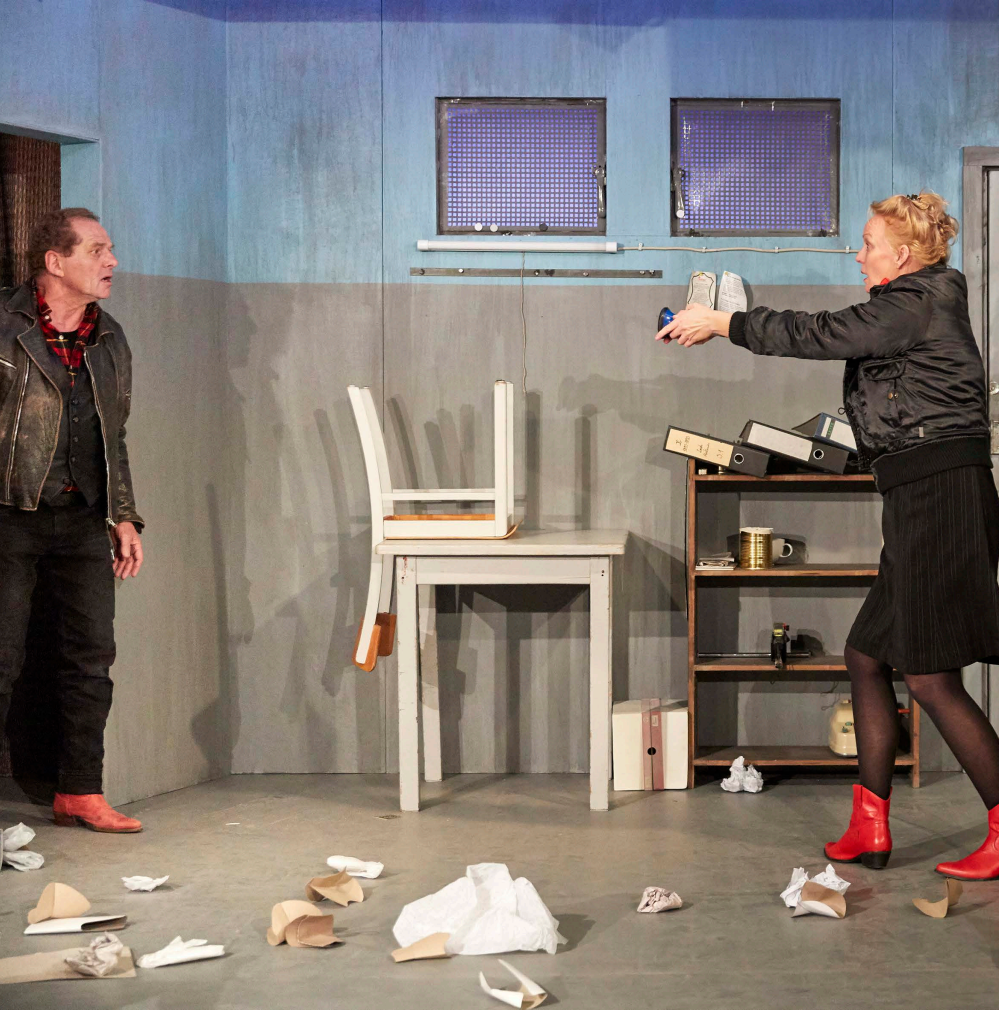
Michael Caine und Gene Hackman in der Rolle der Bonnie und Clyde